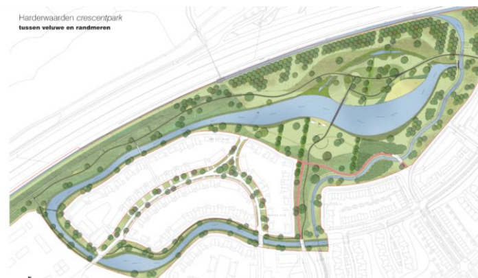
Het crescentpark drielanden